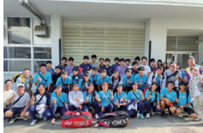
SMEINER HOUSE (宿舍)前合影